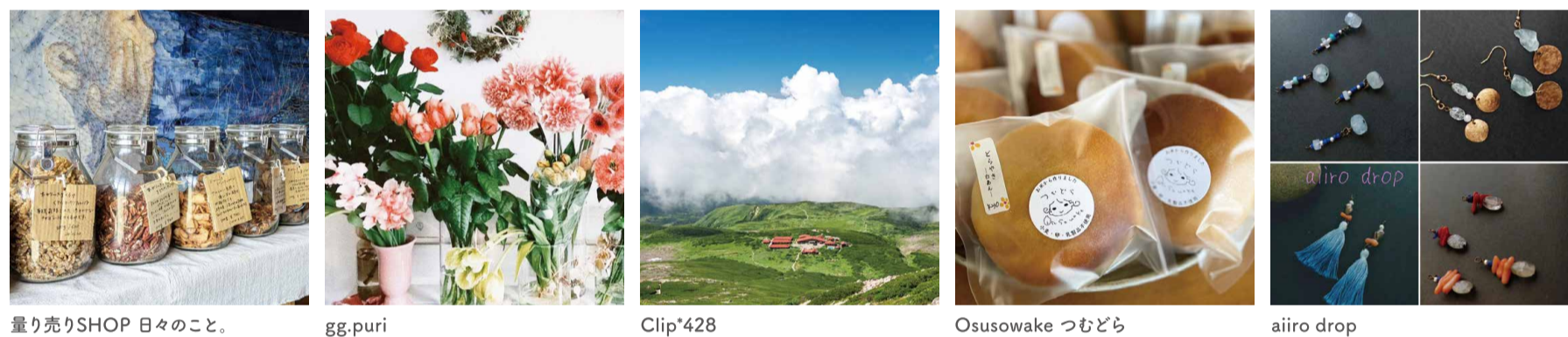
量り売りSHOP 日々のこと。 gg.puri Clip*428 Osusowake つむどら aiiro drop