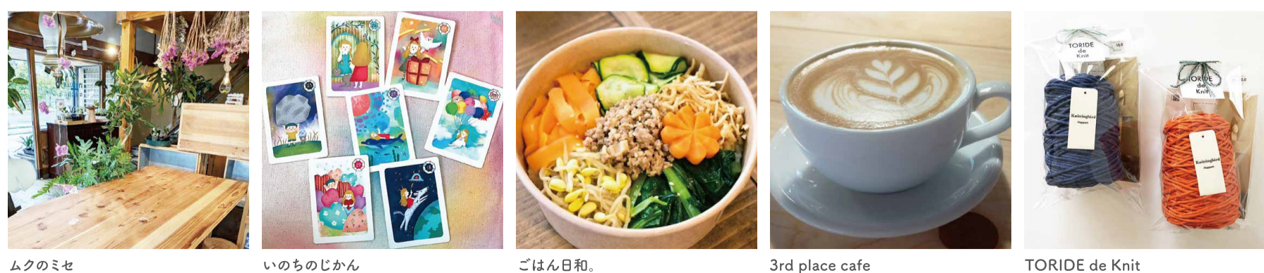
ムクのみせ いのちのじかん ごはん日和。 3rd place cafe TORIDE de Knit